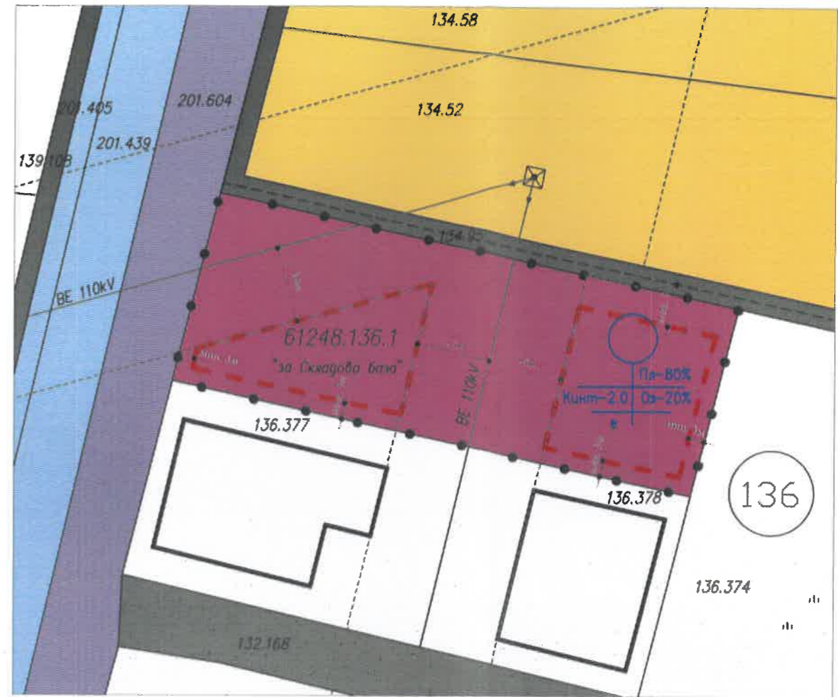
ПРОЕКТ за ПУП-ПЗ на ПИ с идентификатор по КККР № 61248.136.1, м. "Баницето", землище на с. Равно поле, Община Елин Пелин